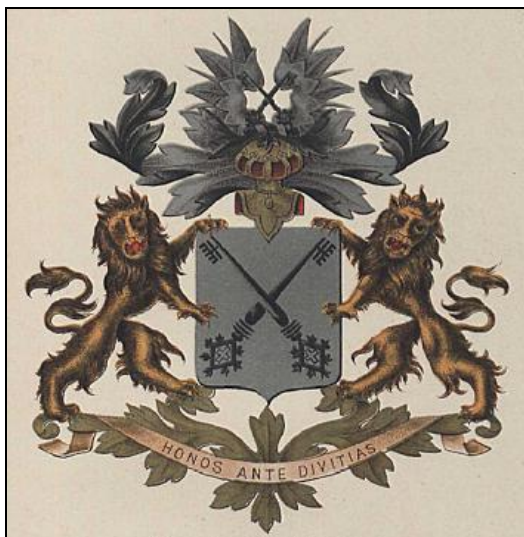
Wapen van het geslacht Schimmelpenninck.

Het Nijenhuis herbergt een historische afdeling met schilderijen, boeken en andere memorabilia die herinneren aan de drie staatslieden Schimmelpenninck; deze collectie wordt beheerd door de in 1995 opgerichte Stichting Rutger Jan Schimmelpenninck.