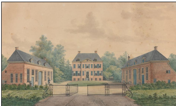
Het Nijenhuis, vooraanzicht met bijgebouwen (1827), voor de aanbouw van de torens (voor) en vleugels aan de achterzijde.

Het Nijenhuis heeft de tand des tijds uitstekend doorstaan, mede dankzij de zorg die de eigenaren eraan besteed hebben en ook blijven besteden. Van oudsher bij buitenplaatsen en landgoederen behorende onderdelen, zoals bouwhuizen, de woningen van de koetsier (c.q. chauffeur) en jachttopziener, de moestuin, de oranjerie, een ijskelder en een theehuisje zijn tot op heden aanwezig.